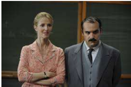
la maîtresse et le Bouillon